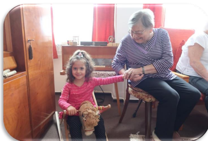
setkání s dětmi z mateřské školy – vyprávění o starých hračkách