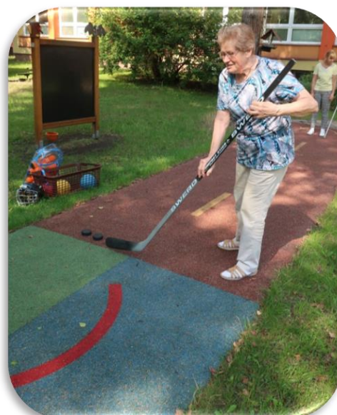
pohybové aktivity v přírodě