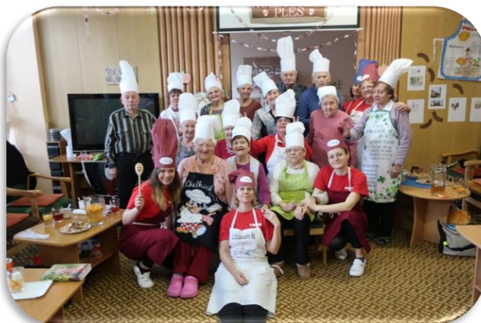
společné oslavy – kulinářský ples