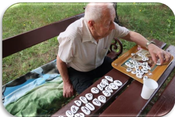
trénování kognitivních funkcí