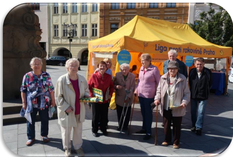
kontakt se společenským prostředím